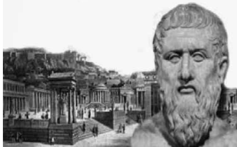
ΠΛΑΤΩΝ ΓΙΑ ΤΗΝ ΑΔΙΚΙΑ

"Αδικία είναι η συνεχής περιφρόνηση και καταπάτηση των Νόμων. Η μεγαλύτερη αδικία είναι, το να θέλει κάποιος να φαίνεται δίκαιος, ενώ δεν είναι".